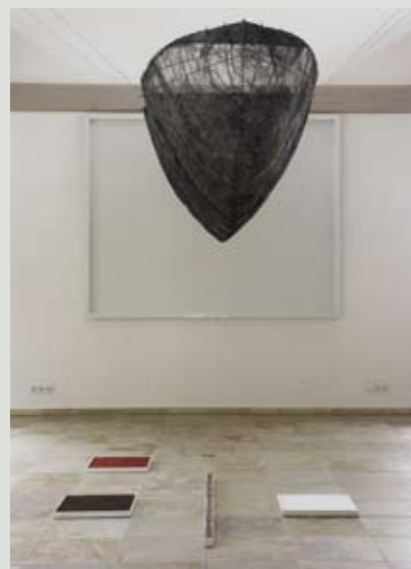
„Via aura“ Unterwegs, Sibylle Falkenberg (Schwelm) 1. Preis, Ortung IV, 2005

281 Künstlerinnen und Künstler aus Deutschland und aus dem Ausland beteiligten sich an der Wettbewerbsausschreibung; davon wurden 19 Teilnehmerinnen und Teilnehmer für den Kunstparcours ausgewählt.